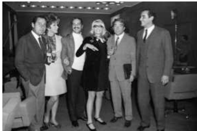
DREAMERS 1968, AGI, Riunione alla sede dell'Agis di attrici, attori, registi e produttori per la fondazione dell'accademia cinematografica, 1 novembre

Altre sezioni saranno dedicate alla musica italiana e internazionale e alle grandi imprese sportive del '68, come la vittoria ai Campionati Europei della Nazionale Italiana a Roma contro la Jugoslavia.