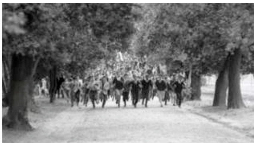
DREAMERS 1968, Disordini durante la battaglia di Valle Giulia, 1 marzo

L'esposizione proseguirà nella sezione " La dolce vita ": ci sarà, anche grazie al contributo fornito dal Museo Nazionale del Cinema, il Bel Paese della dolce vita del noto Piper Club di Roma, punto d'incontro di alcune famose celebrities nazionali e internazionali come l'attore Sean Connery , il cantante Adriano Celentano , il regista Federico Fellini , l'attore Alberto Sordi , l'attrice Anna Magnani , il cantante Massimo Ranieri , il regista e attore Vittorio Gassman , il cantante Domenico Modugno . E non mancherà anche qui un riferimento alla Torino dell'epoca, con Caterina Caselli ripresa con alcuni operai negli allora stabilimenti FIAT .