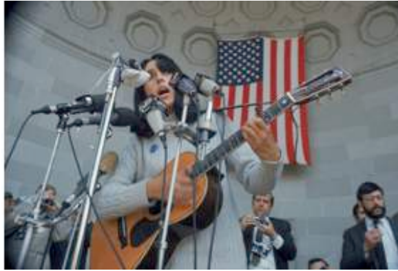
DREAMERS 1968, Joan Baez canta durante una manifestazione contro la guerra a Central Park New York, 3 aprile