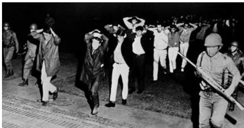
DREAMERS 1968, AFP, alcuni studenti vengono arrestati durante una manifestazione a Città del Messico, 23 settembre

Ad accogliere i visitatori ci saranno i grandi "sognatori del futuro" ; attraverso le figure di Martin Luther King e Bob Kennedy il pubblico sarà guidato all'interno della cronaca internazionale del '68: dalla guerra del Vietnam alla segregazione razziale negli USA, dalla presidenza di Nixon alla fine della Primavera di Praga , dalla Grecia dei colonnelli al maggio francese fino agli scontri tra l'esercito e gli studenti a Città del Messico , si ripercorreranno alcuni degli eventi che hanno influenzato e cambiato le sorti della storia del mondo. Eventi che sono raccontati nel libro 1968 dalla scrittrice Oriana Fallaci , testimone diretta, dal Vietnam al Messico, dei fatti di quell'anno cruciale.