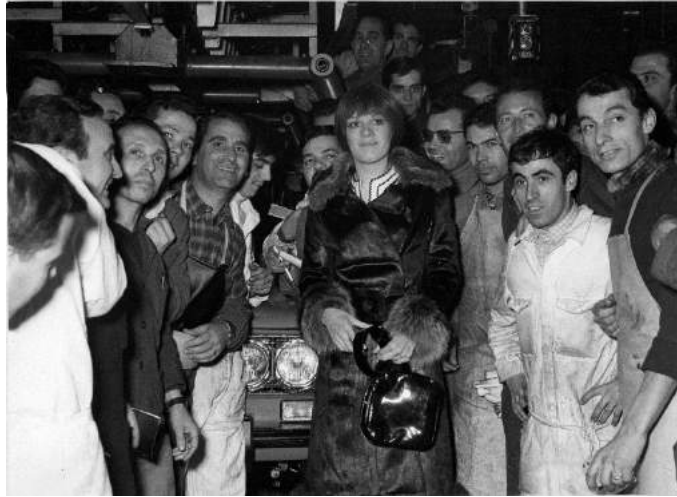
DREAMERS 1968, CENTRO STORICO FIAT, Caterina Caselli in visita allo stabilimento Fiat Mirafiori.