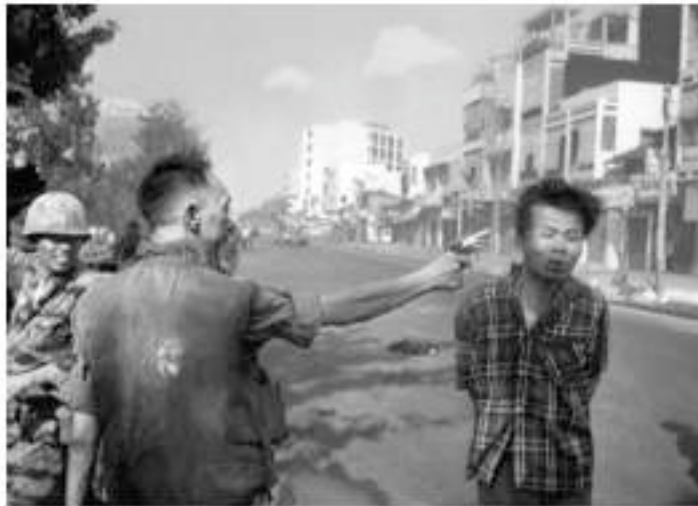
DREAMERS 1968, Un sospetto Viet Cong viene giustiziato per strada da Nguyen Ngoc Loan capo della Polizia Nazionale vietnamita a Saigon, 1 febbraio

Seguiranno poi le occupazioni, le contestazioni e le rivolte studentesche : in particolare, saranno ripercorsi i tragici scontri tra studenti e forze dell'ordine avvenuti nella famosa " Battaglia di Valle Giulia " nonché i numerosi scontri e scioperi che hanno caratterizzato la Torino dell'epoca. Nel capoluogo piemontese, infatti, il 1968 comincia in anticipo, con l'occupazione studentesca di Palazzo Campana, sede dell'Università: è l'inizio di un anno di lotte contro il potere accademico, unite agli scioperi operai. Sarà, inoltre, riportato un ciclostile originale dell'epoca, per rievocare i momenti della ribellione per mezzo della stampa di volantini e giornaletti universitari.