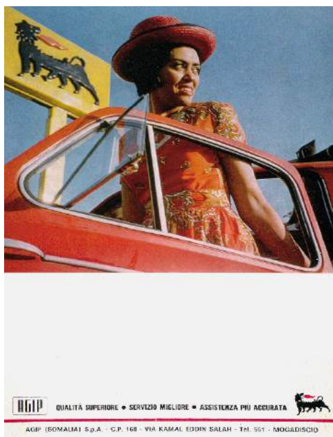
DREAMERS 1968, ENI, Manifesto pubblicitario AGIP Somalia

I grandi personaggi che hanno segnato in maniera indelebile quell'anno "rivivranno" attraverso i loro discorsi più famosi. Grazie ad alcuni pannelli speciali, sarà possibile leggere estratti del discorso pronunciato da Martin Luther King il giorno prima di essere assassinato, il "discorso sul Pil" di Bob Kennedy , la poesia "Il PCI ai giovani" e il testo "Vi odio cari studenti" di Pier Paolo Pasolini .