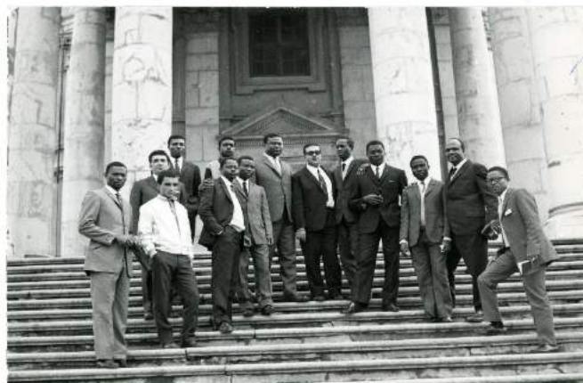
DREAMERS 1968, Borsisti del 1° Corso di specializzazione bancaria per i paesi Africani in visita alla Basilica di Superga

Anche l' innovazione tecnologica avrà il suo spazio all'interno della mostra. Sarà presente, infatti, una sezione dedicata al grande fermento tecnologico del 1968 che culminerà con lo sbarco sulla luna di Neil Armstrong del 1969.