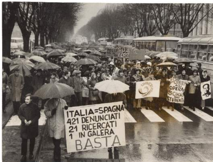
DREAMERS 1968, ARCHIVIO STORICO DELLA CITTÀ DI TORINO, il corteo degli studenti in corso Vinzaglio si dirige verso via Cernaia, marzo