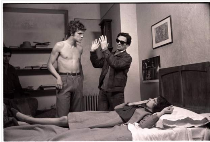
Pier Paolo Pasolini, Silvana Mangano e Carlo De Mejo sul set di "Teorema".