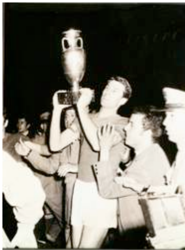
DREAMERS 1968, Giacinto Facchetti capitano della Nazionale alza la coppa dei campionati europei vinti a Roma contro la Jugoslavia, 10 agosto

Anche l' innovazione tecnologica avrà il suo spazio all'interno della mostra. Sarà presente, infatti, una sezione dedicata al grande fermento tecnologico del 1968 che culminerà con lo sbarco sulla luna di Neil Armstrong del 1969.